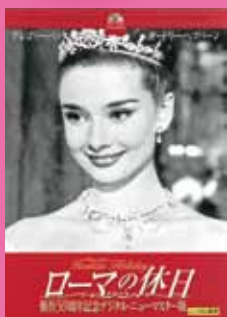
業務用DVD (デジタルリマスター版)での上映となります。提供：(株)M.M.C