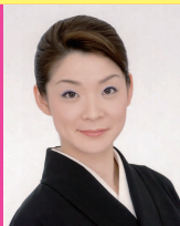
Shizuhisa Fujikage Japanese Dance